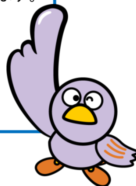
埼玉県マスコット コバトン

http://www.saitamaken-npo.net/html/tsukaikata.html