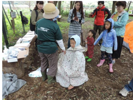
防災キャンプ 野外トイレ