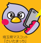
埼玉県マスコット 「さいたまっち」