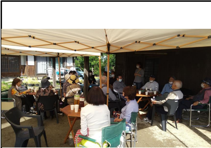
宮城県東松島市あおい地区 住民の方々(右)と早俣・葛袋 地区住民(中央・左)の交流会 (10月15日)