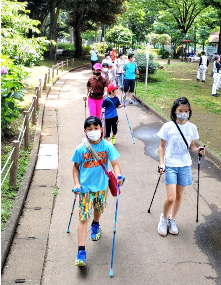
←子ども達のノルディック