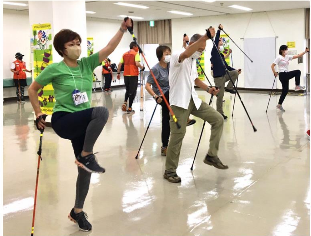
↑ ボディメイクノルディック