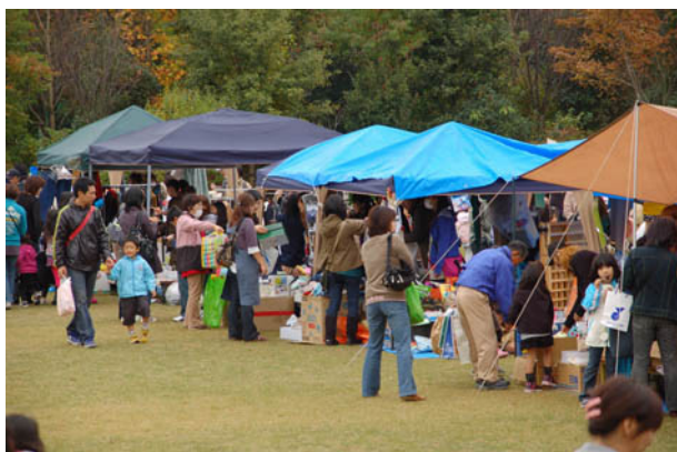
フリーマーケットも開催された