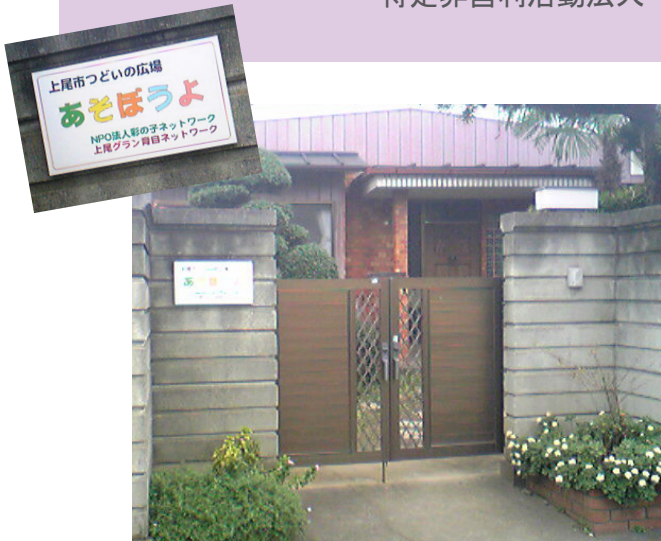
彩の子ネットワークの事務所とサロンは住宅地のなかにある