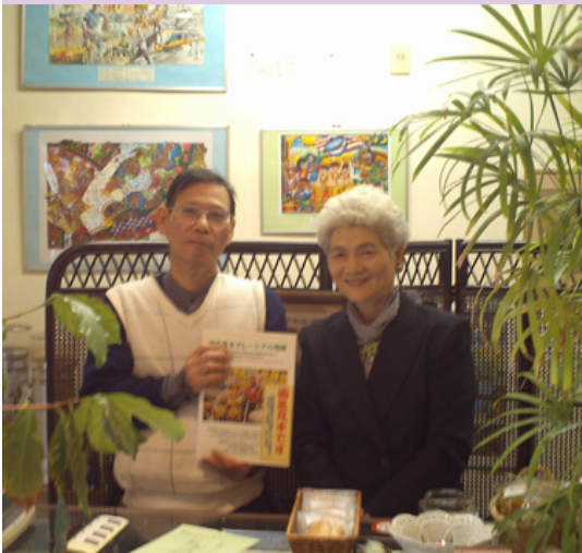
店内に飾っているマレーシアの子どもたちの絵の前で

マレーシアのマハティール首相（当時）が「（日本は）困ったときの友人」と述べたように、日本との良好な関係を示しているマレーシアと、絵を通じてさらなる友好を深めているのが「メイあさかセンター」である。