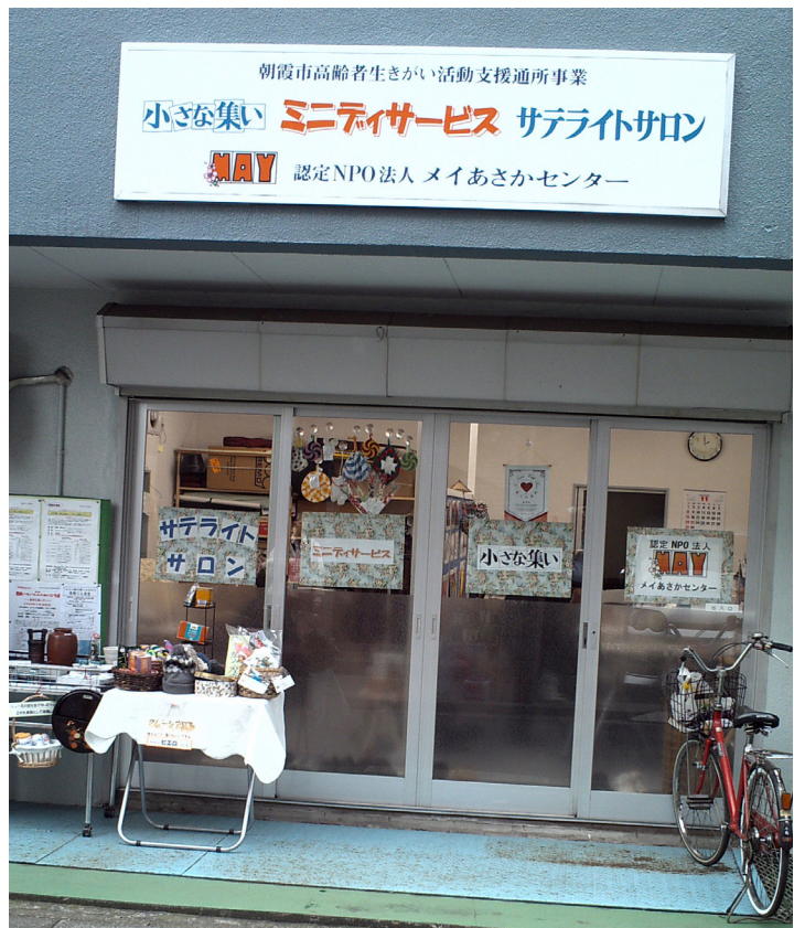
メイあさかセンター ミニデイサービスサテライトサロン

け足で走り回る時も、交換会に訪れた先でも、現地代表（マレーシア人）の方のマレー語を自ら通訳しているとのことであった。マレーシアの大学で日本語を教える立場でもあるそうで、「つたないマレー語ながらも、これからもマレー語で通訳するという事にこだわりを持っていきたい」という。