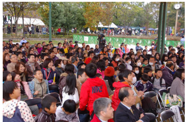
観客も熱くなった