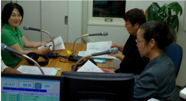
母親たちの抱える負担について語る様子

「鶴ヶ島なごみ」は、子どももお年寄りも障がいのある方も、誰もが幸せで安心して生活できるよう、地域の中でお互いに信頼して助け合いができる場所として、2000年6月に誕生し、2001年5月に法人の認証を受けた。