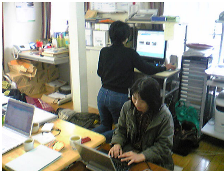
事務所で働くスタッフはみな子育て中のお母さん

この会は個人会員146名、団体会員24団体で、参加者総数は約2,400名という。会員は、拠点を置くさいたま市、上尾市だけでなく、県北は熊谷市や深谷市、県南は川口市、戸田市、県東は草加市、栗橋市、県西は秩父市までの県内全域にわたる。また、東京都、千葉県、栃木県、群馬県などもネットワーク化されているという。老若男女の区別なく全ての人を対象に、自立し、互いに尊重し、主体的に生きてゆく意識を持ち、自らの意志の元に行動し、世代を超え障がいを超えた「互いに支えあう地域社会」のネットワークが、声なき