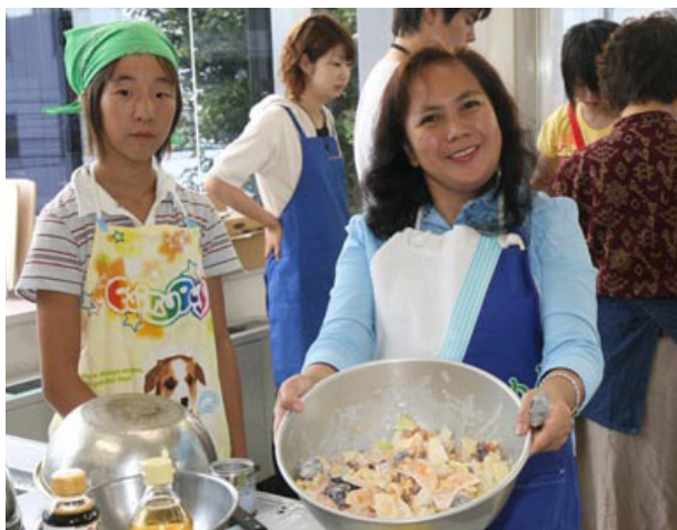
ディスカバーワールドで餃子作りを

受益者である外国人からの収入は見込めない。今もスタッフは全員無償。外国人支援という心労が多いセンターの活動を思うと頭が下がる。