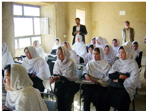
1989年成人を対象に「技術習得奨励基金」を創設。自立のための看護師、検査技師学校を併設し、1995年には生徒数1300人を超え、初の高校卒業生を送るまでになった

2001年9月に同時多発テロが起こり、10月米国がアフガニスタンのタリバン攻撃を開始、リーシュマニアの治療薬の値段が高騰した。その間日本では、奈良駅前アフガン難民支援の募金活動を行なったが難民の数も増大し、依然資金不足は解消されない。会では新難民を対象に新たに移動クリニックを開始した。ここでは