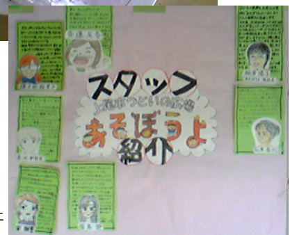
スタッフのプロフィールも壁に貼ったメモで紹介されている