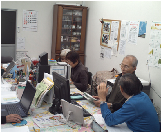
「ミニデイサービス」の風景