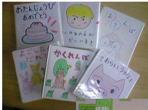
高校生が作った手作り絵本

子育てサロン「あそぼうよ」は、0歳から2歳までの子どもがいる7名の母親がスタッフになり、「子育て」をしながら業務をするという場になっている。来所している母親と「子育て」について話をしたり、他の母親の育て方を見て子育ての疑問や不安の解消につながればとの考えだ。「子育てサロン」は一人だけが話をする場ではないので、談話相談室「どんぐり」でゆっく