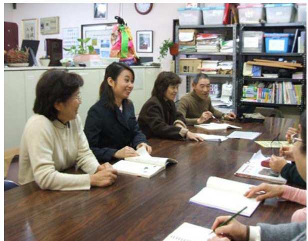
中国語教室で先生を囲んで

行政からの業務委託や、企業や個人の寄附などに頼るところが多いのだが思うようには集まらないのが実