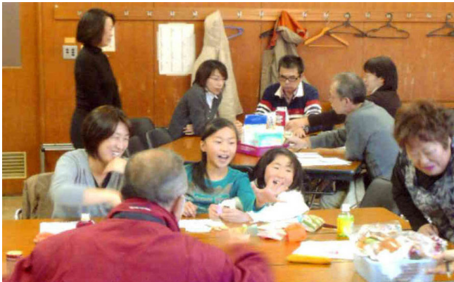
市民を対象にした環境学習講座を草加市で行なった

ニフォームや公園のベンチ等に再利用されたり、高炉などで助燃材などに使われているようだ。