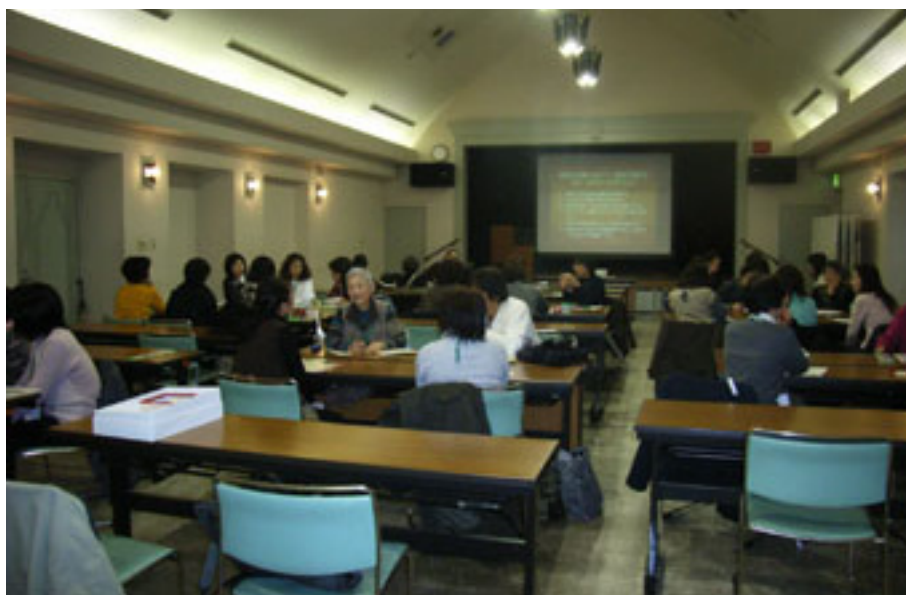
2008年度、「災害危機における独居高齢者、障害者支援事業」で県内にはメンタルサポーター71人が生まれた。メンタルサポーター研修会(浦和会場)

このホームページによる広報は一般企業では常識である。ネット上で広く“見られる”からだ。このセンターを訪れる相談者も事前に公式サイトでチェックしているという。日常の活動を記録して発表することは、大事な要素だと改めて気付かされた。