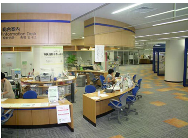
「さいたま市市民活動サポートセンター」総合案内。市民活動の経験者が、さまざまな相談に対応している

この会は、指定管理者として「さいたま市市民活動サポートセンター」をさいたま市市民活動支援室と協働で運営している。市民活動サポートセンターとは、地域や社会のさまざまな課題を解決するために、市民が自主的、自発的に取り組んでいる活動や、自治会活動など、非営利で公益的な活動のための施設である。活動の紹介や呼びかけなど、市民活動団体や個人の情報発信が出来るコミュニケーションボードやパンフレットラック、打ち合わせやミーティングのための交流スペース、チラシやポスターなどの印刷物を作成するための印刷機など、活動を支援するための様々な機能がある。建物の維持管理は主に行政が担い、市民活動のためのさまざまな講座やセミナー、啓発活動、相談会、各団体間のネットワークなど、ソフト面の企画・運営を主に会が担っている。