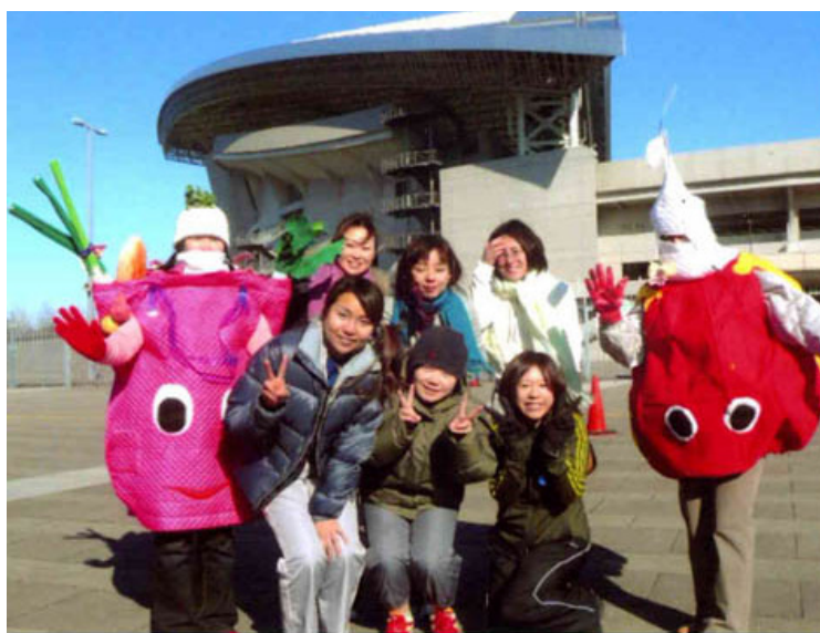
埼玉スタジアムでエコ駅伝のイベントに参加した買い物袋の着ぐるみ

かつては、牛乳瓶、酒瓶、ジュースの瓶など多くの容器が繰り返して再利用（リユース）されていたが、現在の主流となっているペットボトル容器は、再利用が進んでいない。しかし、回収されたペットボトル容器やプラスチック製品は他の製品に生まれ変わったり（リサイクル）、企業のユ