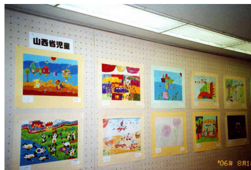
中国山西省の子どもたちの作品も出品された