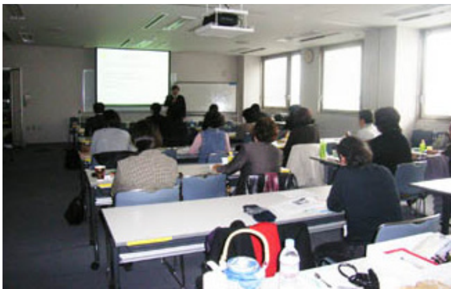
メンタルサポーターをサポートする 有資格者、アドバイザーもいる。 アドバイザー研修会（2009.1.24）