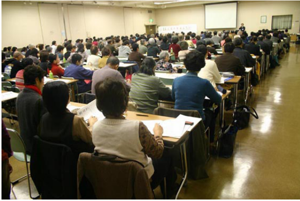
さいたま市役所との「協働」で開催した「認知症フォローアップセミナー」