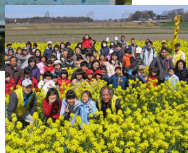
菜の花畑と子どもたち

地域人ネットワークは、現役時代、なかなか地元を振り返る機会がなかった定年後の埼玉都民を集めてつくられ