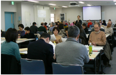
互助システムの学習会

埼玉県は2009年度における老年（65歳以上）の県民全人口に対する比率は18.99%に達している。2000年より2009年までの人口増が21万人弱に対し老年人口増は51万人を超え2倍以上の増え方である。要介護（要支援）認定者も2000年度の6万5千人から2009年度には3倍近い18万人になっている。