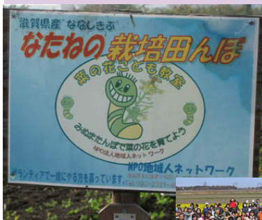
「なたねの栽培たんぼ」の看板