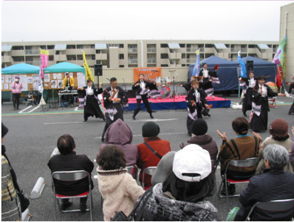
大宮サティでの「大宮同心」のステージの様子

「フリーマーケット主催団体協議会」は、1986年に「フリーマーケット実行委員会」としてニチイ行田店でフリーマーケットを開催したことが起源だ。2004年に、市民に対する自然や環境への理解を普及させるための事業や市民活動を担うボランティアの育成、市民活動団体に対する支援を行い、豊かで充実した市民社会づくりに寄与することを目的に法人として設立した。