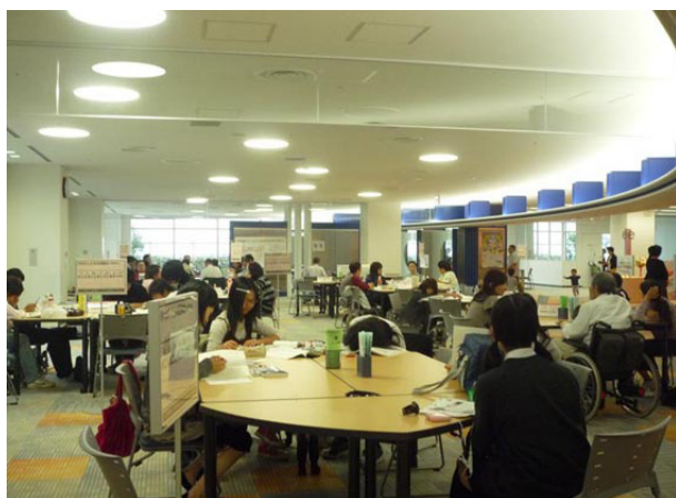
ミーティングスペース、市民の活動のためならだれでも自由に利用することができる