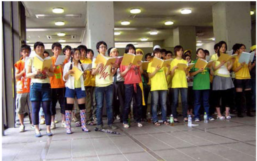
朗読の様子。埼玉大学の学生と一緒に3ヶ月かけて練習発表