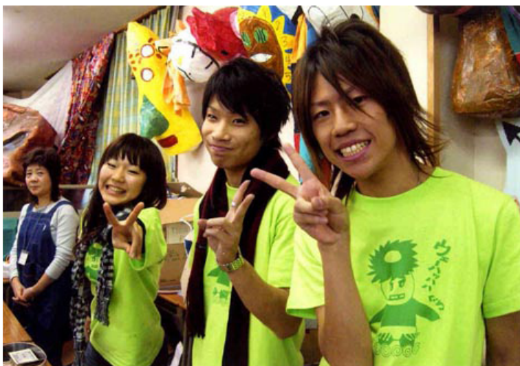
地域交流バザール。3ヶ月かけて準備し、店員として自分たちですべて行う

生徒たちが地域の各家庭を回り、提供してもらえるいろいろな商品を集めてくる。それをみんなで値段を決めて、陳列して販売する。「いらっしやいませ」「ありがとうございました」と心を込めて感謝の言葉を返すことも忘れない。宣伝には、生徒たちが自ら作ったチラシを1万枚ほど配る。こうした活動を通じて子どもたちの表情が明るくなり、行動も活発になっていく。年を追うごとに盛況となり、今年は提供商品が200件を超え、5日間の参加者は1,195人だった。開校当初は「変な団体が地元に来た…」といぶかられたそうだが、ようやく地域に認められたと実感できるようになったという。