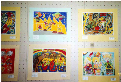
浦和で行われた日中の児童絵画展の日本の子どもたちの作品