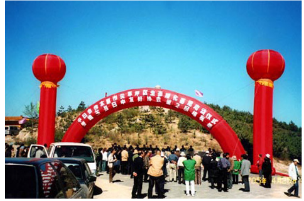
2005年太原市尖草坪で実施された「汾河生態造林緑化事業」

2008年上田知事は、訪中団を率い植樹祭に参加し、現地政府関係者に加えて、農業に従事する民間人、小・中学生たちと友好を誓いあった。