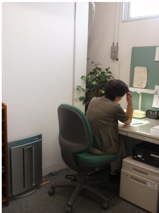
電話で相談を受けるスタッフ

談を受けるボランティアを募集しているとのことなので関心のある方はぜひお問い合わせいただきたい。