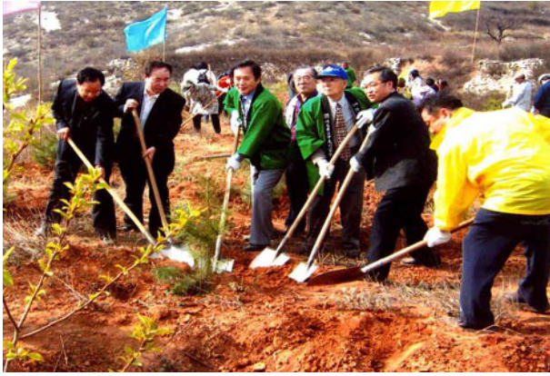
2006年4月上田知事も植樹祭に参加

大連外国語学院・遼寧師範北京外国語の各大学に派遣し、2009年には延べ1200名になった。また、1990年から1996年までに、県内学校法人等の協力を得て延べ230名の留学生を受け入れた。