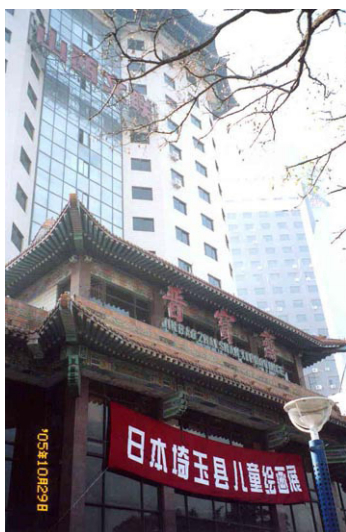
太原市で開催された児童絵画展

具体的な活動は、中国物産展（1971年～、さいたま市玉蔵院境内にて25回）、日中友好書道家交流展（埼玉県、中国山西省・河南省）、中国水墨花鳥展（戸田市）、在日中国歌舞団公演（県内10カ所）、中国河南省雑技団公演（県内7カ所）、黒龍江省方正地区日本人公墓修復募金、阪神大地震チャリティー音楽会、南京城壁修復募金等である。留学生の派遣は、1984年に山西大学に派遣して以来、河南・鄭州・