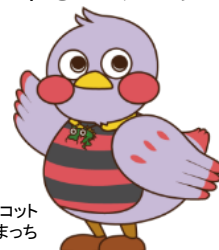
埼玉県マスコット さいたままっち

新型コロナウイルス感染症については、主催団体にて感染症予防対策を徹底し、開催方法の工夫など必要な措置を講じていただきますようお願い申し上げます。